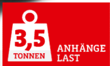
D-Max Modelljahr 2019